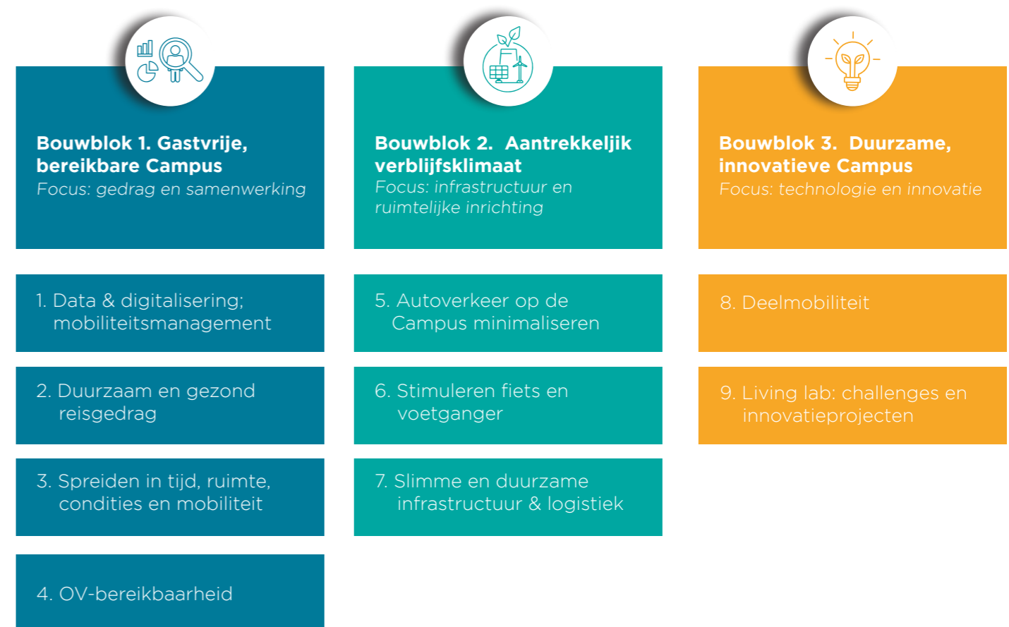
Figuur 3. Visualisatie van drie bouwblokken en negen focusprojecten

Vanuit de drie centrale, onderling samenhangende bouwblokken zijn projecten geformuleerd en gestructureerd. Elk met een eigen focuspunt waarmee de diverse facetten van mobiliteit worden belicht. Zowel de ambities van de betrokken partners als de (meer dan 140) mobiliteitsopgaven van het Klimaatakkoord hebben een belangrijke rol gespeeld in de projectformulering.