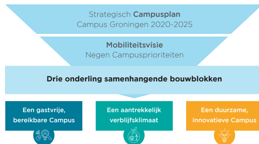
Figuur 2. Samenhang ten behoeve van de actieagenda Smart Mobility Campus Groningen 2022-2030

De prioriteiten zijn verenigd in drie centrale, onderling samenhangende bouwblokken. De drie bouwblokken vormen de rode draad in deze actieagenda: